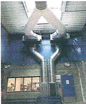
Les gaines d'air froid assurent une diffusion régulière dans l'ensemble du volume d'exploitation en 15-25.

Gandon fait appel à Afatek pour la mise en conformité des installations du réseau, en particulier pour le suivi des températures. Par ailleurs, le logisticien a coordonné, dans un esprit proactif, le déploiement de l'informatique embarquée entre les différents partenaires Astrata et Idem Telematics, et le fournisseur de groupes frigorifiques Carrier Transicold ; l'objectif étant de développer de nouveaux systèmes d'alertes de pannes du groupe frigorifique, avec possibilité d'intervention sur des réglages ou l'arrêt d'un groupe frigo, à distance, ou encore sur la pré-alerte en cas de panne de gasoil, entre autres.