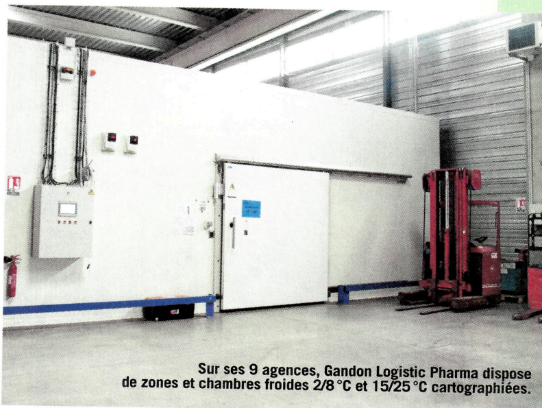
Sur ses 9 agences, Gandon Logistic Pharma dispose de zones et chambres froides 2/8°C et 15/25°C cartographiées.

différents, indique Joël Gandon. Ses membres ont les mêmes procédures et exploitent, en direct et à l'aide de partenaires locaux, des réseaux domestiques 2/8°C et 15/25°C dans tous les pays européens ainsi qu'en Turquie et Russie. Pour nous challenger, des au-