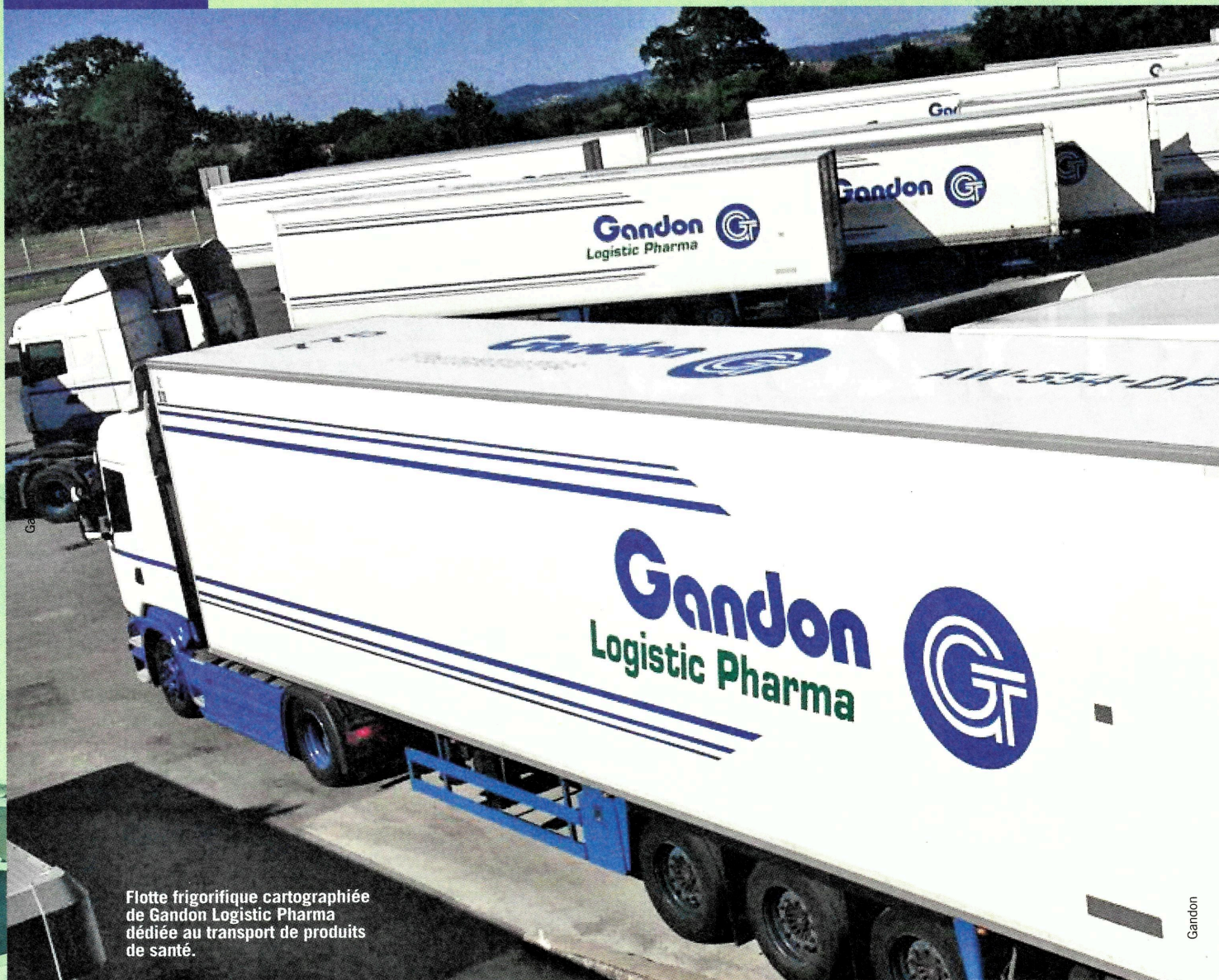
Flotte frigorifique cartographiée de Gandon Logistic Pharma dédiée au transport de produits de santé.